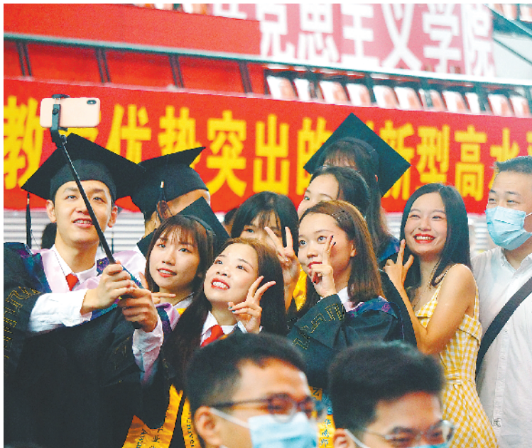
华师毕业典礼现场

9 日,华南师范大学 2020 年学生毕业典礼暨学位授予仪式在石牌校区手球馆举行。据悉,本次典礼仪式设立线上线下“双会场”,2020 届 200 名博士硕士毕业生、200 名本科毕业生参加主会场典礼仪式,约 1.1 万名毕业生及家长在线参加典礼仪式。在仪式上,校长王恩科承诺:以后每年的毕业典礼都为 2020 届毕业生开放,欢迎毕业生带着家人朋友重返母校,再拾庆典,共叙旧情。