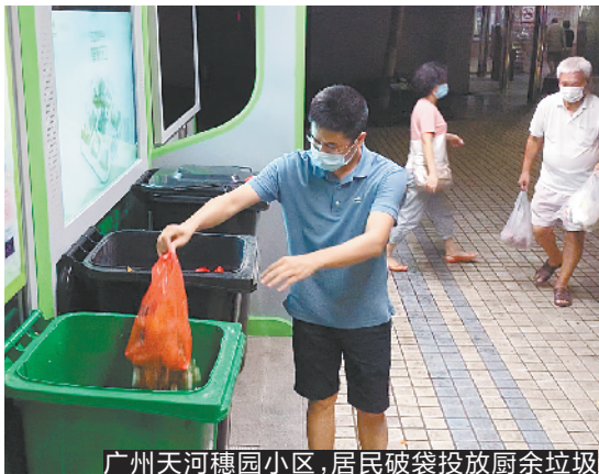
广州天河穗园小区,居民破袋投放厨余垃圾