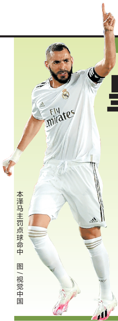
本泽马主罚点球命中