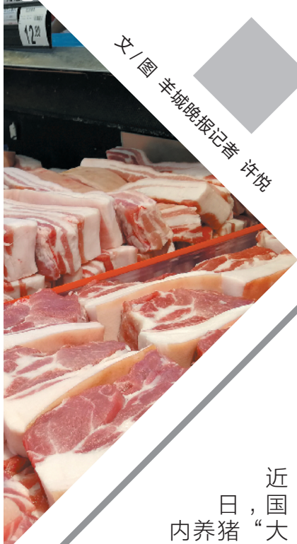
文/图 羊城晚报记者 许悦