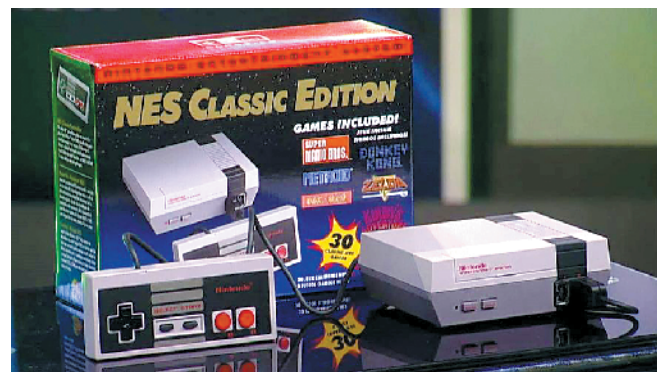
《超级马里奥兄弟》当年就是配合任天堂这款游戏机推出市场