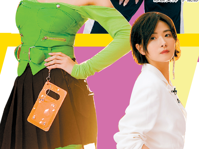
霸气外露的张雨绮

么投入”,伊能静当场用哭泣打断了赵兆的点评,还将自己表现不佳的原因归结为“耳返没有声音”。这种表现也被网友认为是“输不起”“无法正视别人的评价”,虽然事后伊能静公开向赵兆道歉,但收效甚微。