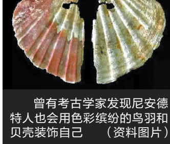
曾有考古学家发现尼安德特人也会用色彩缤纷的鸟羽和贝壳装饰自己 (资料图片)