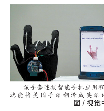
该手套连接智能手机应用程序,就能将美国手语翻译成英语语音

手套看上去跟普通手套并无两样,但在里面安装的一个薄薄的可伸缩的电子传感器,却可以发挥大作用。这个传感器连接着掌心到五个手指头,在此范围内作出的手的动作便可以智能识别。不同的动作和相应手指的位置可以代表手语中的字母、数字、单词和短语,手套将这些信息收集后转化为电子信号,然后发送到戴在手腕上的电路板上,该电路板又将信号无线传输到智能手机上,智能手机就可以以大约每秒一个字的速率将信号转换成语音。通过测试,研究人员已确定该系统可以识别660个标志,包括字母表中的每个字母和从0到9的数字。研究人员还尝试将传感器安装在人脸上,比如眉毛之间或嘴巴内