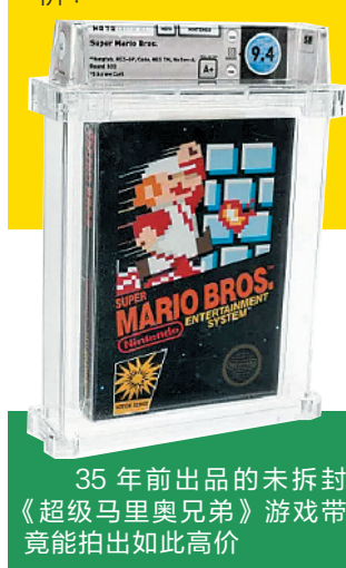
35年前出品的未开封《超级马里奥兄弟》游戏卡带竟能拍出如此高价

难怪总有些人家里囤满了旧东西不舍得扔,说不定哪件曾经不起眼的老物件,一出手就能身价翻番成“爆款”。但为何一盒老款游戏卡带也能售出天价?