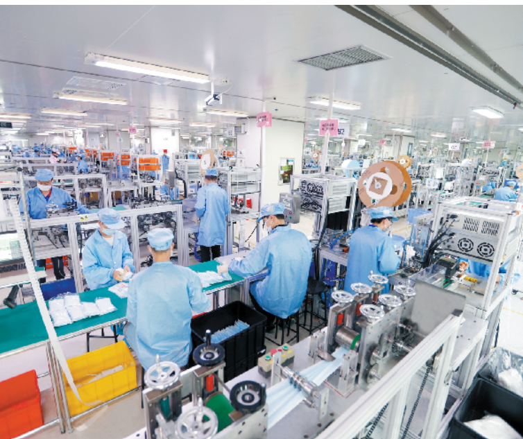
比亚迪口罩生产车间 羊城晚报记者 王磊 摄(资料图)

制造业是实体经济的主体,深圳制造业当前正处于爬坡过坎、转型发展的关键时期。近日,深圳市工业和信息化局牵头起草了《深圳市关于推动制造业高质量发展暨坚定不移打造制造强市的若干措施(征求意见稿)》(以下简称《若干措施》)。根据《若干措施》,深圳将建立重点产业链“链长制”,打造具有国际竞争力的产业链。