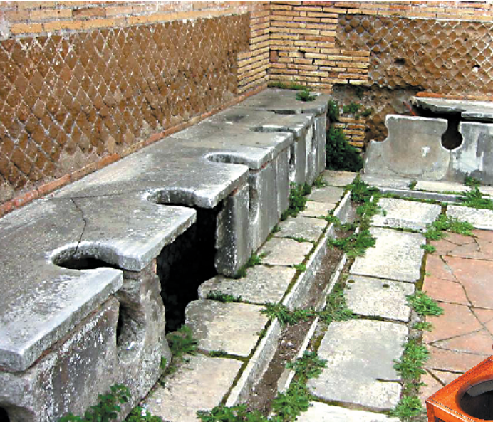
▲古罗马时期的公共厕所

近年来,中国发起了“厕所革命”,大力推进农村厕所改造,改善农村公共卫生状况,减少环境污染,阻断疾病传播途径。居民每日光顾厕所,它对居民生活和健康影响重大。为引起世界人民对厕所的重视,2001年成立了世界厕所组织,2013年联合国还把每年的11月19日设立为“世界厕所日”。今天我们来看看古代的厕所又是怎样的呢?