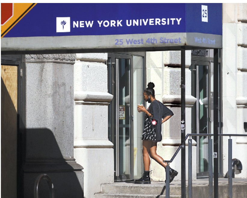
7月14日,一名女子查看美国纽约大学教学楼入口处张贴的通知

据新华社电 美国波士顿联邦地区法院法官伯勒斯14日在开庭审理哈佛大学和麻省理工学院提起的相关诉讼时宣布,美国联邦政府同意撤销日前发布的留学生签证新规。伯勒斯在庭审开始时表示,据他所知,诉讼双方已达成解决方案。他说,美国政府将撤销留学生签证新规,撤回详细说明这项新规的常见问题解答,并恢复春季发布的针对新冠疫情期间国际学生在线学习的指导意见。今年3月,美国总统特朗普宣布“国家紧急状态”以应对新冠疫情。美国国土安全部下属入境和海关执法局随即发布指导意见,为应对疫情,在紧急状态下采取签证豁免政策,允许国际学生在线学习。7月6日,美国入境和海关执法局发布通报说,2020年秋季学期的留学生如果仅上网课,将无法取得赴美签证或维持当前签证。这项针对留学生的签证新规招致美国社会广泛批评及多项诉讼。哈佛大学和麻省理工学院8日率先提起诉讼,请求联邦法院叫停签证新规。诉状说,这项签证新规违反美国联邦《行政程序法》,是在没有提出任何正当理由、未经公众评议且考虑不周的情况下发布的。随后,约翰斯·霍普金斯大学等高校、包括加利福尼亚州在内的多个州和美国首都华盛顿也提起诉讼,要求阻止新规实施。约百名国会议员联名致信美国国土安全部,呼吁撤销留学生签证新规。据报道,截至14日开庭,两校诉讼获得美国数百所高校、70多个高等教育团体和谷歌、微软等十几家高科技公司提交法律文件予以支持。这些高校和教育团体表示,签证新规将危及包括留学生在内所有学生的健康安全,损害美国高校的学术利益和经济利益。美国高科技公司在支持两校诉讼的法律文件中说,国际学生不仅给美国经济带来每年数百亿美元的直接贡献,还有助于确保美国企业“继续引领世界创新”。如果国际学生因签证问题被迫回国,美国企业和整体经济都将受到严重影响。美国高校和媒体普遍认为,美国政府出台留学生签证新规的主要目的是施压美国学校秋季学期正常开学,学生返校上课,从而全面重启经济。但当前美国疫情不断加重,国际旅行限制严格,新规使大量留学生处境困难,也打乱了众多高校针对疫情所作的秋季学期教学安排。据美国国际教育协会的统一统计数据,美国高校学生中留学生约占5.5%,人数接近110万,其中中国留学生约占三分之一。