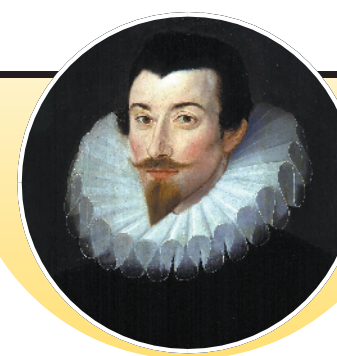
抽水马桶发明人约翰·哈灵顿

入下水道冲走。考古也发现,大约在公元前1800年希腊的克里特岛、埃及和波斯也出现了厕所。2012年,考古学家在越南南部发现了公元前1500年的厕所。中国东汉时期(公元25年-公元220年)还发明了一种“猪圈厕所”,厕所与猪圈连在一起,人的排泄物流入猪圈,与猪粪一起积攒起来当肥料;当然,猪也会吃人的粪便,这种厕所很容易传播疾病。古罗马也有水冲公共厕所,在水冲沟渠上覆盖石板,每隔一定距离挖出葫芦状缺口,成为马桶模样的座位。戴克里先(公元244年-公元312年)执政时期,在罗马城建了141座公共厕所。当时的公共厕所还有一个功能,在里面放置一个桶搜集人的尿液,尿液被用于皮革鞣制,当时政府还对这些桶征税,俗称“尿税”。