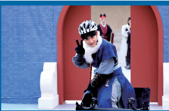
近年活跃在档综艺节目中

至于曾经在《达拉崩吧》中小露一手的唱跳技能,周深幽默地表示:“不会再尝试了,唱跳真的不是一般人能做的事,未来希望就好好唱歌。为唱跳歌手们加油!你们真的很辛苦。”