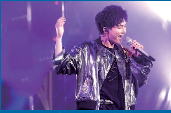
在《歌手·当打之年》中开发唱跳技能