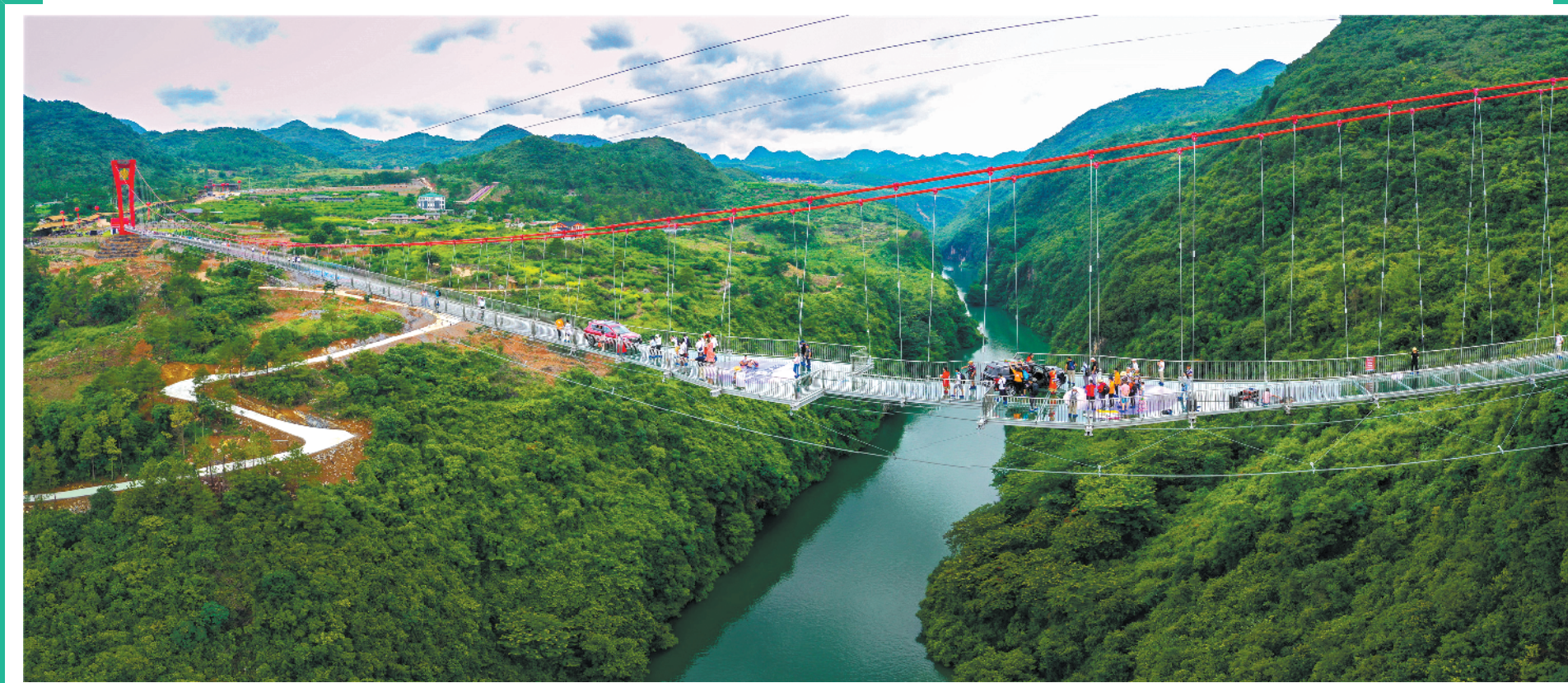
广东清远湟川三峡擎天玻璃桥是目前世界上最长的玻璃桥