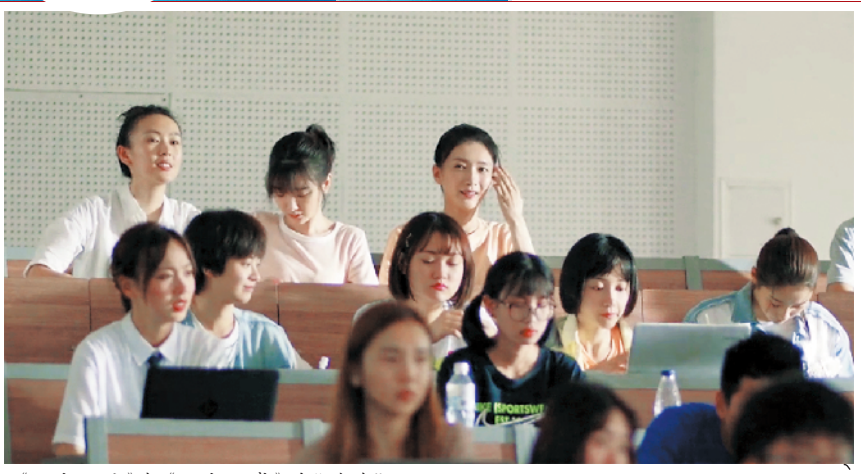
《三十而已》与《二十不惑》的“联动”