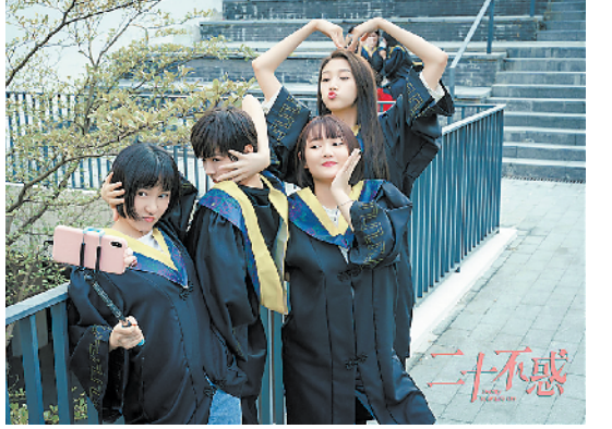
大四女生，急速成长