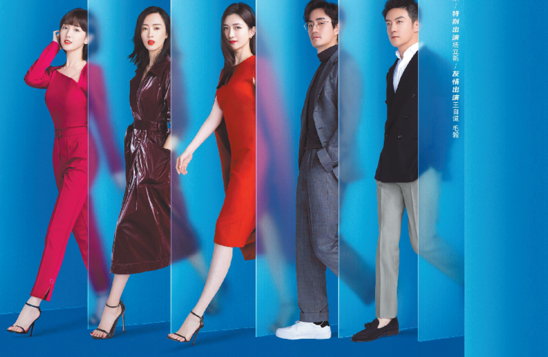
羊城晚报记者 龚卫锋