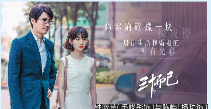
钟晓芹(毛晓彤饰)与陈屿(杨玏饰)