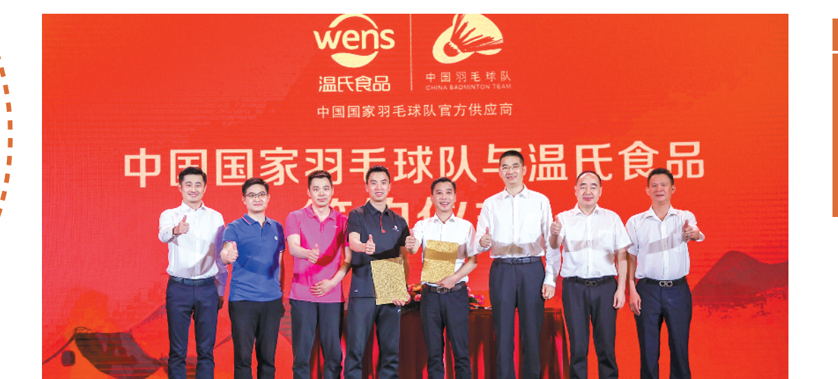
与国家羽毛球队签约现场

今年7月26日,温氏食品集团股份有限公司(简称温氏股份)迎来37周年生日。37年前,温氏股份创始人温北英先生怀揣一颗带动农民兄弟劳动致富的初心,组织七户人家,筹集八千元资金创建了簕竹鸡场。