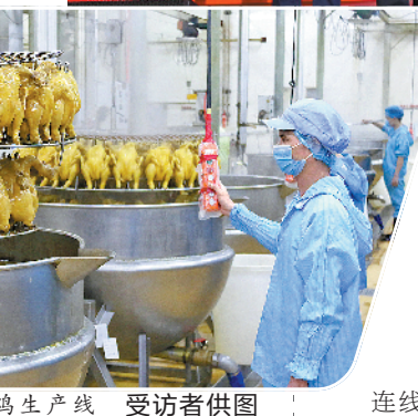
温氏佳味熟食鸡生产线

温氏股份今年4月发布的2019年年报显示,去年温氏又创造了一个新的最好成绩,全年实现营业收入731.2亿元,实现净利润139.67亿元。