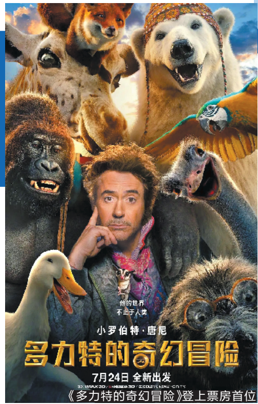
多力特的奇幻冒险 7月24日全新出发 《多力特的奇幻冒险》登上票房首位

8月还有多部备受关注的重映片再登大银幕。其中，诺兰经典作品《星际穿越》将在8月2日重映，《哈利·波特与魔法石》将于8月14日重映。