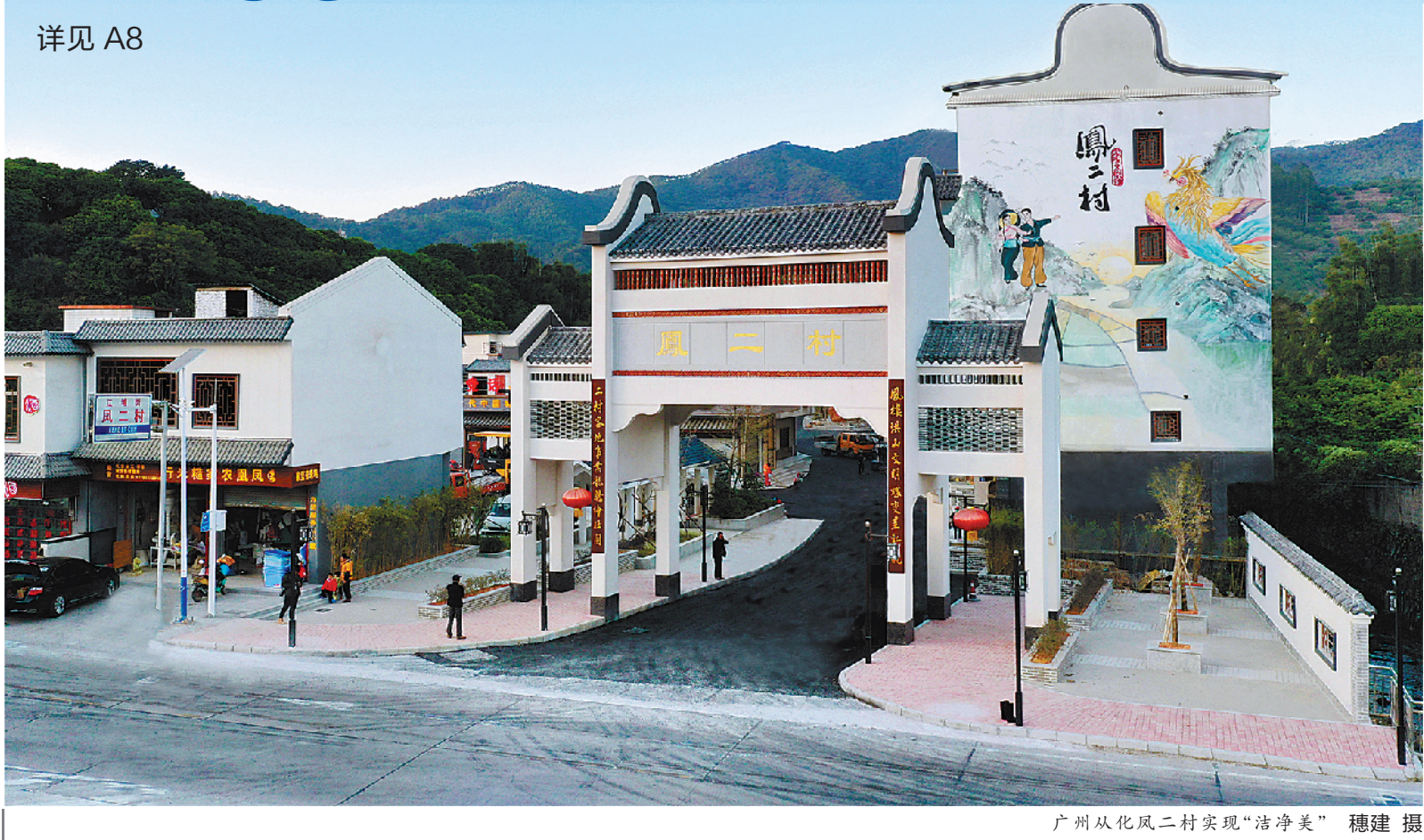
广州从化凤二村实现“洁净美”