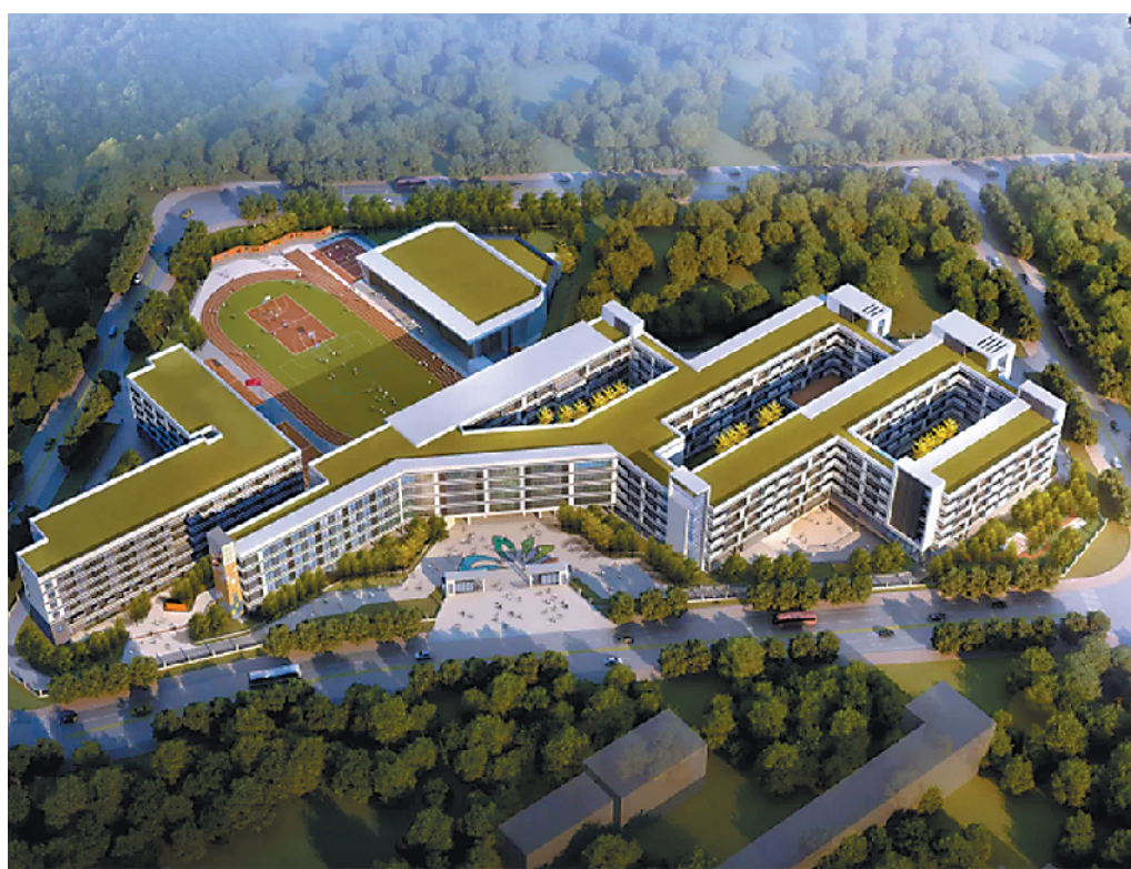
寮步镇香市小学分校(香城小学)效果图