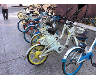
电单车乱停放严重影响市容市貌

据了解,接下来,长安城管部门将继续联系相关企业,自行回收共享电动自行车,对多次告知后仍屡不自行回收的企业,将根据《城市道路管理条例》有关规定予以行政处罚。同时,长安城管部门将继续联合社区对城市乱停放共享单车行为进行更严格的巡查管理,加强对共享自行车企业源头上管控,实行即见即查扣,以彻底改善城市秩序,切实提高长安城市品质。