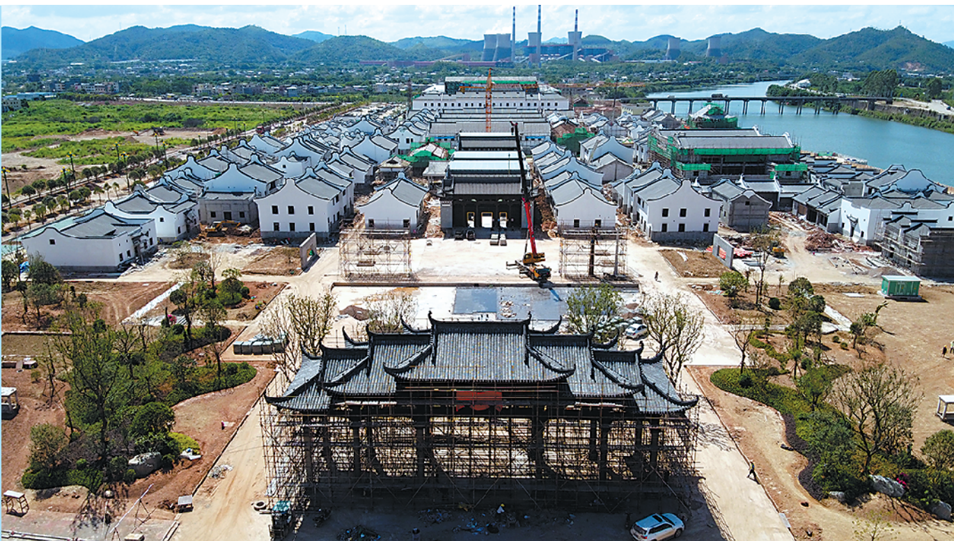
梅州客都人家项目

项目为王,以项目为引擎驱动经济高质量发展,是梅县区在疫情影响下逆势而上、奋发有为的体现。记者从梅县区发改局了解到,今年该区列入省、市、区重点建设项目88项,总投资623.74亿元,年度计划投资80.48亿元,上半年完成投资32.53亿元,为年度计划投资的40.42%,在项目的拉动下梅县区经济持续稳定发展。