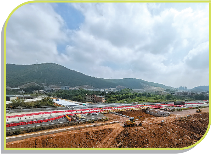
长深高速葵岗互通立交工程

“产业兴区,项目为王、企业第一”。当前,梅县区积极抢抓省委省政府进一步推动老区革命老区原中央苏区振兴发展机遇,积极主动对接上级部门,加强对原中央苏区振兴政策的研究,认真梳理财政、产业、基础设施、公共服务等方面的政策,主动找项目、谋项目、跑项目,争取上级更多更大的支持,享受最大的政策红利。