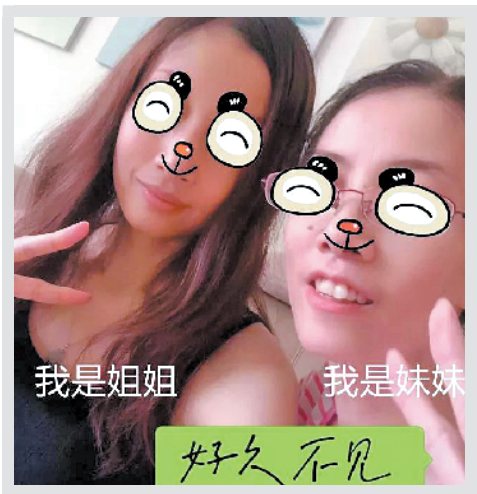
▲姐姐的爱心小纸条 ▲姐妹合影

“亲爱的妹妹,你自己一个人在ICU里和病魔抗争,一定很希望亲人陪在身边,姐姐从今天起每天都会到ICU的门口等你,你有什么需要就让护士找我,你只要知道姐姐每天都在你不远的门口陪着你,你并不孤单!” “这些天医生说暂时不用买白蛋白,但姐姐还是想过来看看你,虽然只能在门口,一扇门之隔并不能见面,但起码离你近一些!” “我的妹妹是最坚强的,有那么多人关心着你,给你力量,幸运之神一定会眷顾我的妹妹的,什么都不用担心,好好休息,好好治疗,如果太累