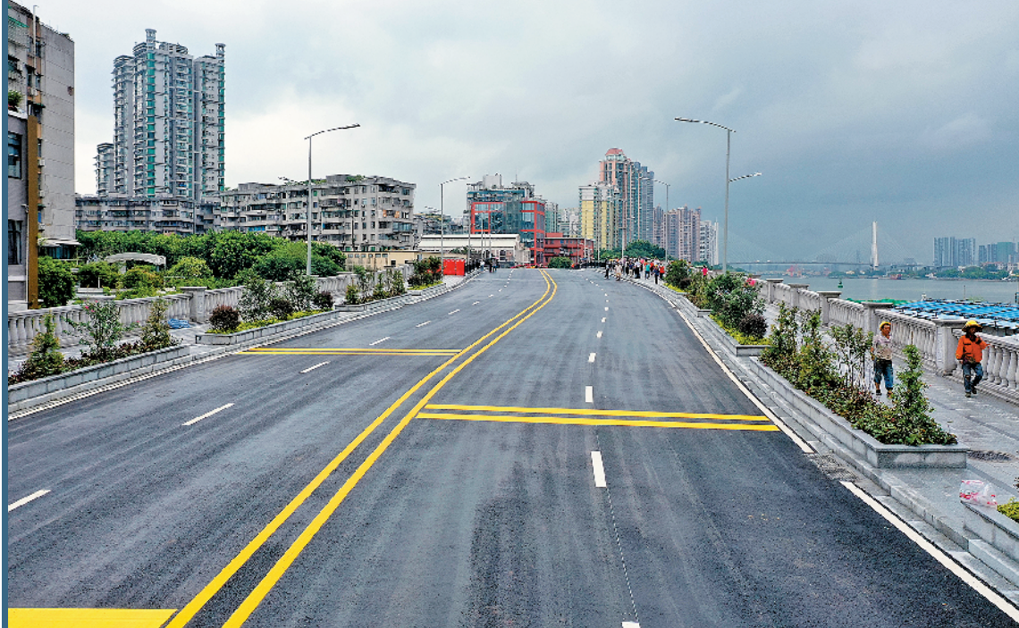
海珠涌大桥已正式开通

3日,记者获悉,广州海珠区环岛路海珠涌大桥已正式开通。该桥连接起河涌两侧已建成的环岛路段,向北可直通滨江西路,向南可接沙渡路,形成一条从琶洲保利天幕广场到太古仓长约18.9公里的沿江道路。据悉,该桥的开通有助于加强海珠区西部南北向的交通供给及区域交通环境,有效缓解工业大道、洪德路的交通压力,改善沿线居民出行条件。同时,该段环岛路将沿线太古仓工业艺术文化景观、滨江公园、珠江前后航道景观、广州塔、会展中心等串联起来,形成一道靓丽的风景线。 海珠涌大桥位于海珠区西北部,北至厚德路,南至新民大街,全长400米,双向4车道。项目有关负责人介绍,该桥于2018年10月正式进场施工,历经664天终于建成通车。“开通这条桥,来我们酒楼喝茶的客人多了!”广州