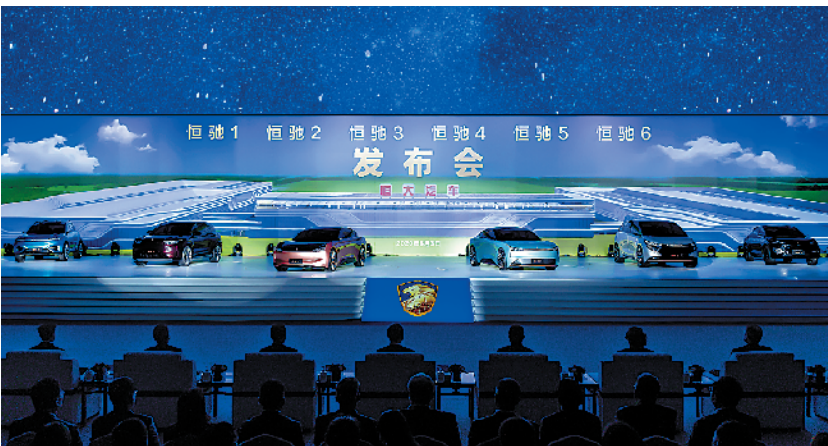
恒驰首期6款车型全球发布