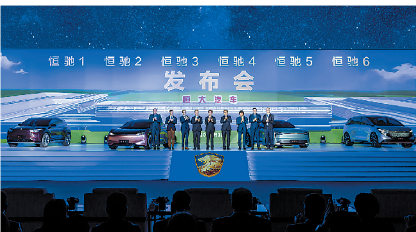
恒驰首期6款车型全球发布会现场合影