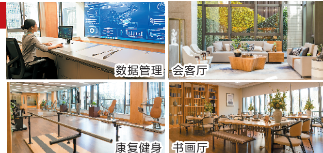
数据管理 会客厅 康复健身 书画厅

基于保利高端养老产品体系与客户个性化需求而诞生的“和熹管家”团队，严选来自五星级酒店、高端养老社区、顶尖学府的跨领域专业人才，要求成员同时具备高端服务管理经验和医疗养老运营管理经验。“和熹公馆”为每位长者配备24小时的专属管家，所有问题只需联系一位管家全搞定，实现全天候全方位覆盖长者需求。“医、养、护、食、住、学”是保利养老一直以来贯彻执行的六位一体专业养老服务标准。为了更好地实现服务供给与长者需求相匹配，天悦和熹会“以客户感知为中心”，将服务体系焕新升级为专业而有温度