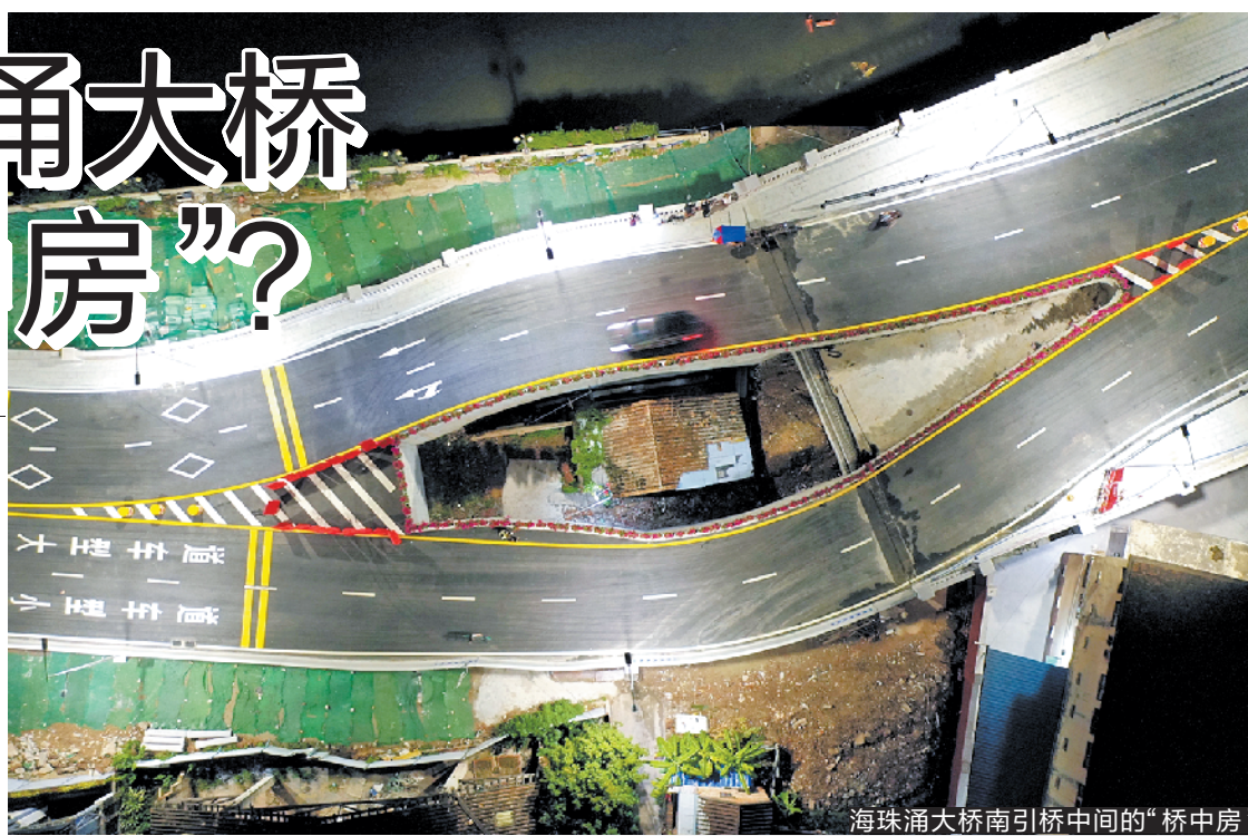
海珠涌大桥南引桥中间的“桥中房”

3日,广州海珠涌大桥建成通车,使海珠区西部多条“断头路”得以打通,历时13年建设的环岛路西片区取得阶段性建设成果。不过,在新桥上通行的街坊也对海珠涌大桥的设计感到好奇,皆因该桥南引桥中间“藏”着一栋有人居住的平房。好端端的桥梁,为何“挖”出一“洞”安置“桥中房”?羊城晚报记者前往一探究竟。