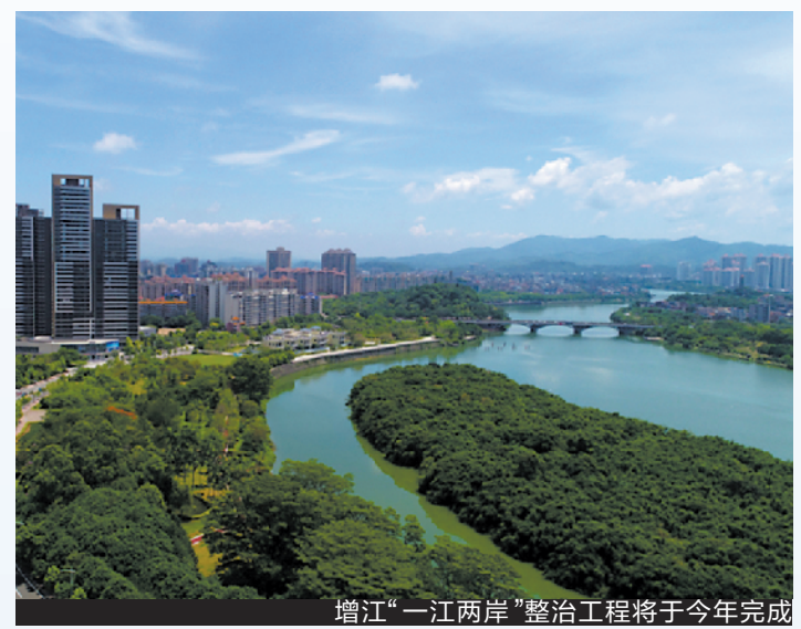
增江“一江两岸”整治工程将于今年完成

“‘岭南之窗’项目振奋人心,是个了不起的创新,是广州文化发展出新出彩中的一个新亮点。”中山大学国家文化遗产与文化发展研究院院长程焕文说,“我做了这么多年的文化研究,从未想到过,我们民间的、最具有地方特色的非遗可以进入广州的地标广州塔,让广州市民、全国民众、世界来访者能够在这里亲身感受广州的文化,还能让非遗传承人与公众亲近。”程焕文认为,“广州首先是要展示、宣传岭南文化,让世界了解广州。‘岭南之窗’项目的建设,对广州文化的宣传推广将起到非常积极的作用。”