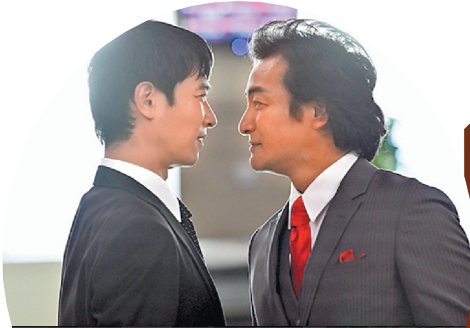
半泽直树(左)继续“职场打怪”