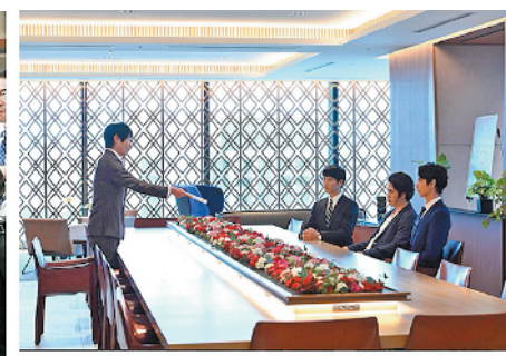
剧集展现了日本职场的众生相