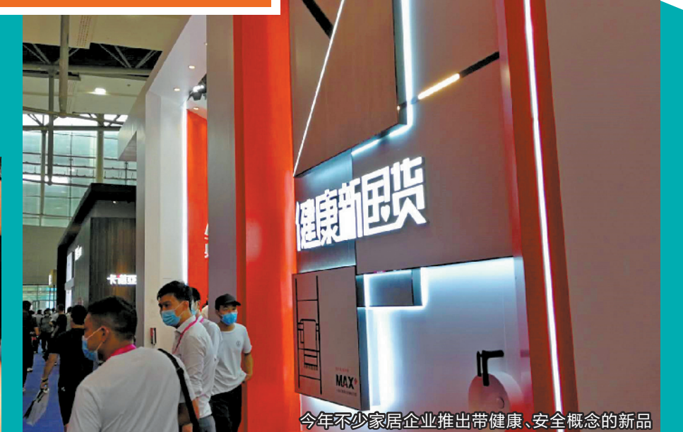
今年不少家居企业推出带健康、安全概念的新品