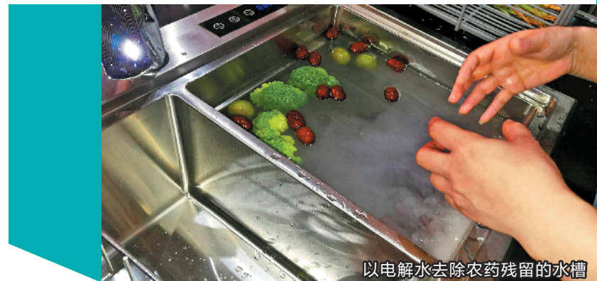
以电解水去除农药残留的水槽

环保性能优于欧标 E0 级板材制作的定制家居产品、专为 0-6 岁儿童设计的无漆木门、外表和普通门无异却能抵御大火 1.5 小时的防火木门、抗噪声良好的三层中空玻璃门窗、以电解水去除农药残留的水槽……在近期结束的一系列家居展览会上，与健康、安全概念相关的建材新品层出不穷，备受观展者关注。