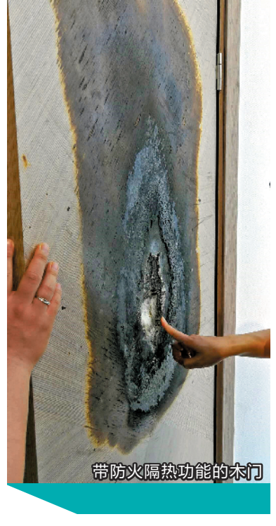
带防火隔热功能的木门

对环境的污染”。 TATA 木门展位一扇半烧焦的木门虽然位于靠里面的位置，但也引来了众多观众。现场工作人员介绍，参展前这扇木门已经经过大约 1.5 小时的灼烧，露出了中央的防火材质。“这扇室内防火门不但能防火，还能隔热。”工作人员转到未被火灼烧的一面说，“别看这门和普通门外表看起来差不多，实际上里面镶嵌了防火性能强的珍珠岩门芯板、隔热效果好的玻璃板，边上还有遇火能膨胀的密封条，有很好的防火隔热性能。” 此外，西门子在展会上展示了防偷窥密码的智能锁，皇派门窗展示了三层中空玻璃的门窗……记者留意到，在展会现场，类似这些带安全、健康概念的产品受关注度都很高。