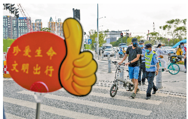
执法人员对轻微交通违法行为进行劝导、教育

羊城晚报讯 记者符畅、通讯员邓慧菲报道：10日，白云区举行摩托车交通安全问题整治誓师大会。据悉，今年6月，白云区因摩托车交通安全问题突出，被定为全省挂牌整治地区。接下来，白云区将每周开展一次全区性集中整治行动，同时依托“智慧劝导码”，更好地对市民进行交通安全警示教育。