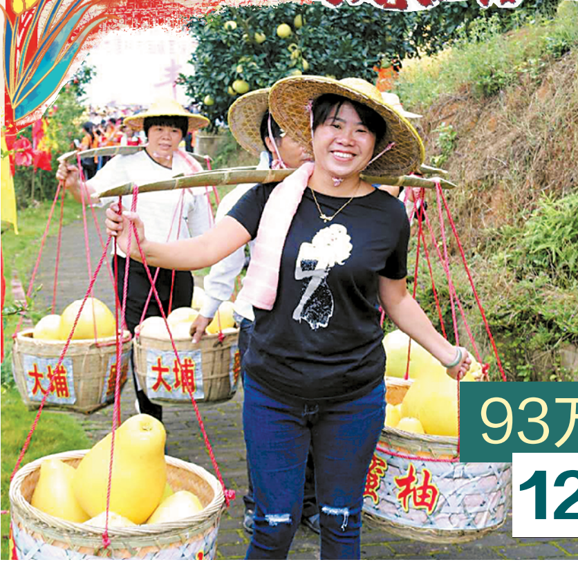
特色梅州柚成为致富果(资料图)