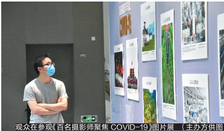
观众在参观《百名摄影师聚焦 COVID-19》图片展

羊城晚报讯 记者黄宙辉、通讯员陈佩湘报道:生死交锋、八方驰援、全民防控、别样生活、复工复产……这些关键词是2020年留给人们难以磨灭的时代记忆。8月11日-28日,《百名摄影师聚焦COVID-19》图片展在广东省立中山图书馆一楼展厅展出,通过54张图片展示了这些时代记忆。