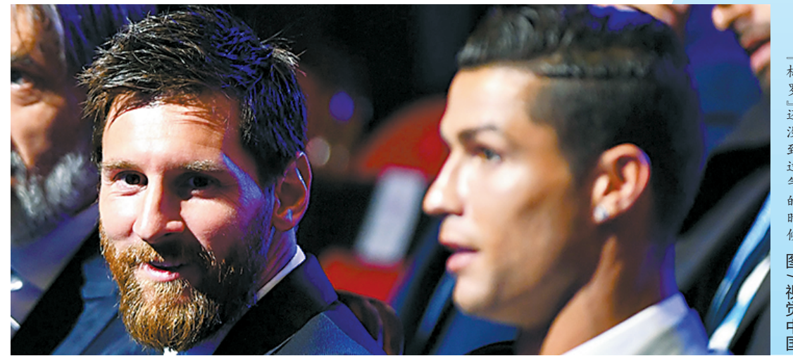
“梅罗”还没到过气的时候 图/视觉中国