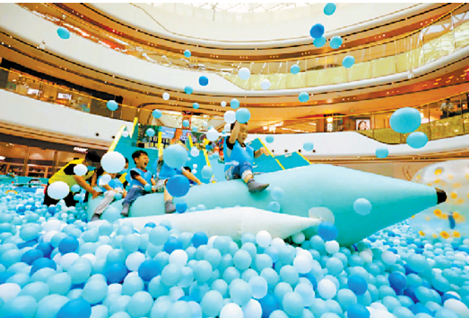
增城系统列促销活动为这个盛夏的消费热情注入“强心剂”