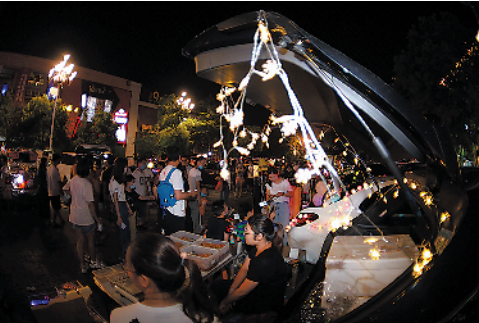
上半年广州 增城区商品销售 总额 1413.15 亿 元，同比增长 33.2%，增速位居 广州第一

增城区科工商信局商贸管理科副科长刘洋向记者介绍，今年上半年增城区以广州打造直播电商之都为契机，先后组织了 6 次大型直播活动，有效拓宽了增城特产、优品的销路。在其辐射带动下，增城区网络零售业保持高速增长，网上零售额 53.47 亿元，同比增长 34.93%，远高于社会零售额增长。