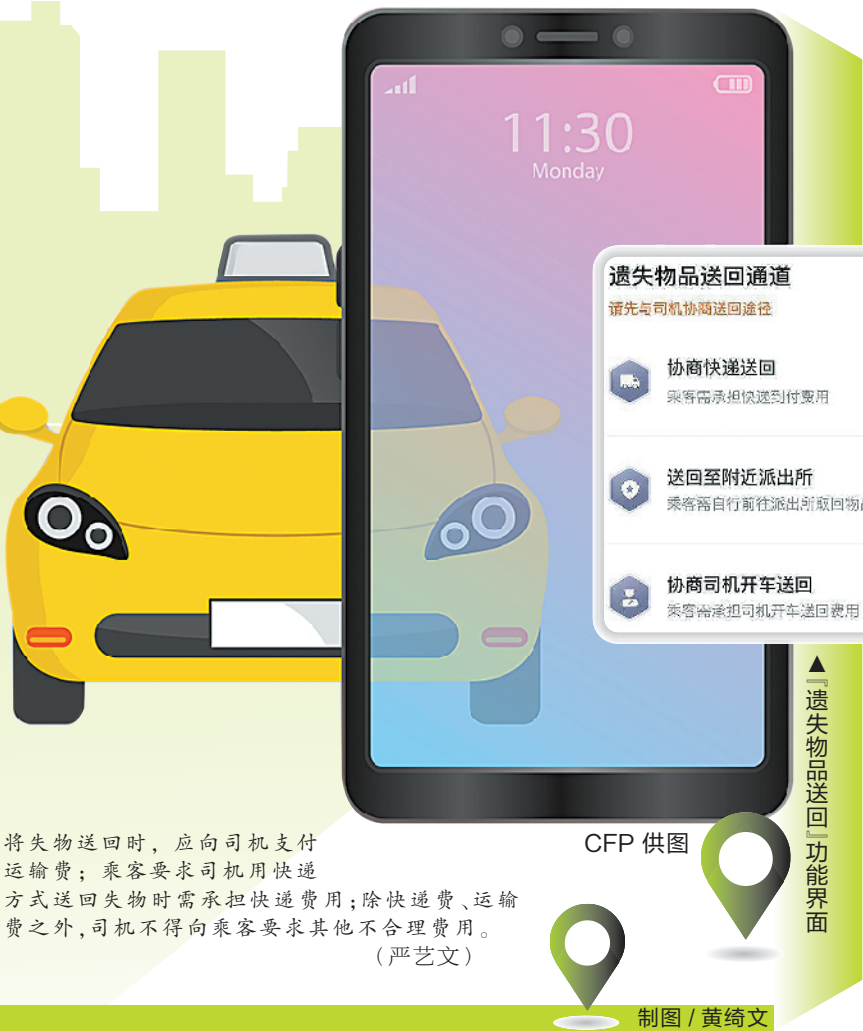
▲遗失物品送回功能界面 制图/黄绮文

将失物送回时，应向司机支付运输费；乘客要求司机用快递方式送回失物时需求承担快递费用；除快递费、运输费之外，司机不得向乘客要求其他不合理费用。（严艺文）