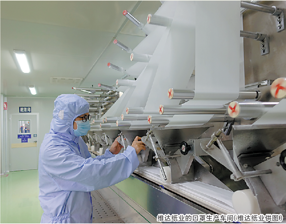
维达纸业的口罩生产车间