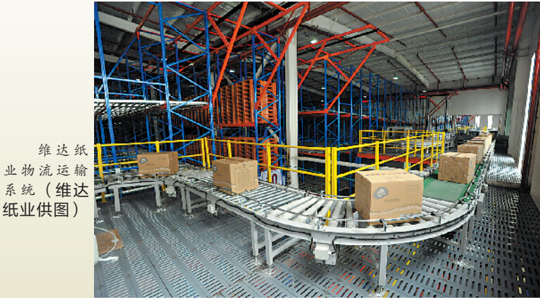
维达纸业物流运输系统

了口罩外,还有消毒纸巾等一类产品也备受市场追捧。尤其是在电商销售方面,维达更是逆势上扬,今年上半年,维达的电商销售额占比增至30%,比去年同期的27%增加3个百分点。“我们对未来发展充满信心,预计今年全年可以继续保持正增长。”作为新会区龙头企业,维达纸业的企稳显示了新会区实体经济有序恢复的良好势头。新会区政府介绍,今年上半年,新会区各项主要经济指标降幅全线收窄,社会消费品零售总额始终稳居全市第一。为了恢复实体经济的活力,新会区大力促进消费升级,举办大润发超市、万达广场夜市活动,采用“短视频+直播模式”等方式卖货。此外,今年新会组织了92家外贸企业参加第127届网上广交会,达成意向订单0.3亿元。