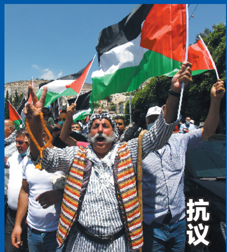
8月14日，巴勒斯坦人在约旦河西岸城市纳布卢斯抗议以色列与阿联酋达成的和平协议。

分析人士指出，阿拉伯国家一向在巴以问题上支持巴勒斯坦，而此次以阿达成和平协议显示出中东地区局势日益复杂化。以色列试图在美国帮助下扩大在这一地区的影响力，今后巴以僵局将更加难解。(新华社)