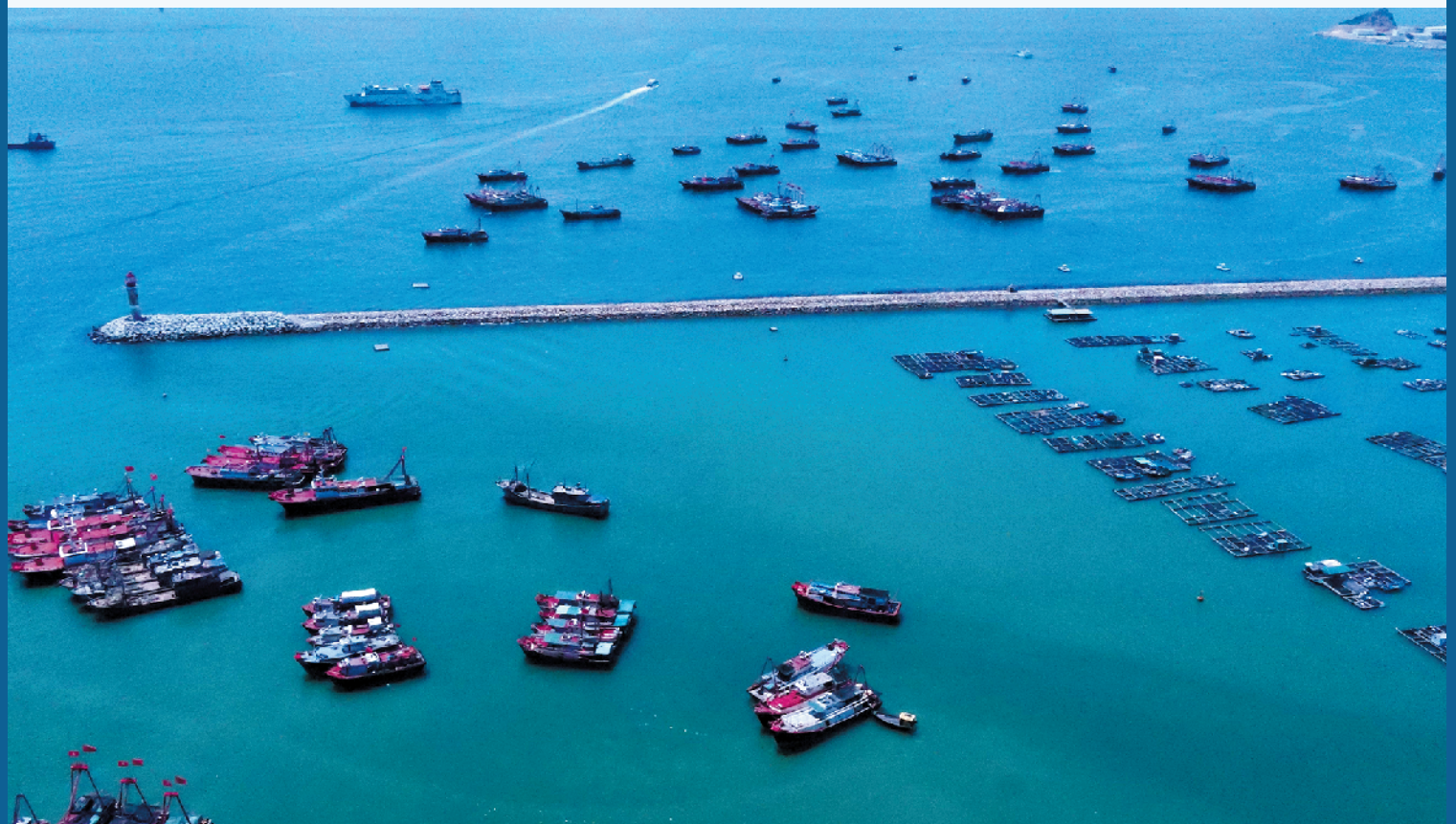
珠海市桂山岛迎来大批港澳流动渔船入境开渔

据了解,因为入境开渔的流动渔船数量太多,万山边检站与桂山镇政府在桂山十五湾新增临时泊位,方便港澳流动渔船停靠和采购物资。