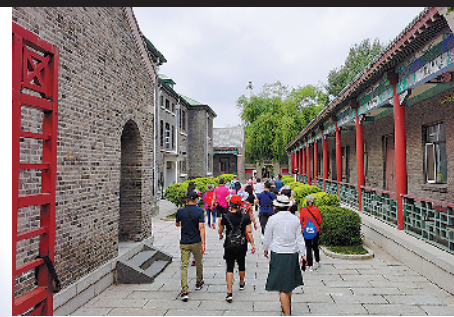
长春伪满皇宫博物院