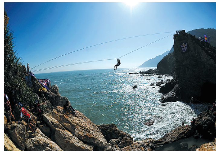
深圳大鹏半岛海岸是户外爱好者的乐园。

自由行分销平台“自我游”数据也显示,暑假的广东省内游有一定程度恢复,虽然订单量不如去年,但客单价比去年同期高:500元、甚至1000至2000元区间的自由行度假产品更加热销,特别是亲子自驾游家庭游客对高品质省内游产品的需求增长明显。同时,进入8月中旬后,接近暑假的尾声,省内景区、酒店等预定更加便利,也有利于家庭自驾游,市民不妨根据自己的实际情况,合理选择出游时段。