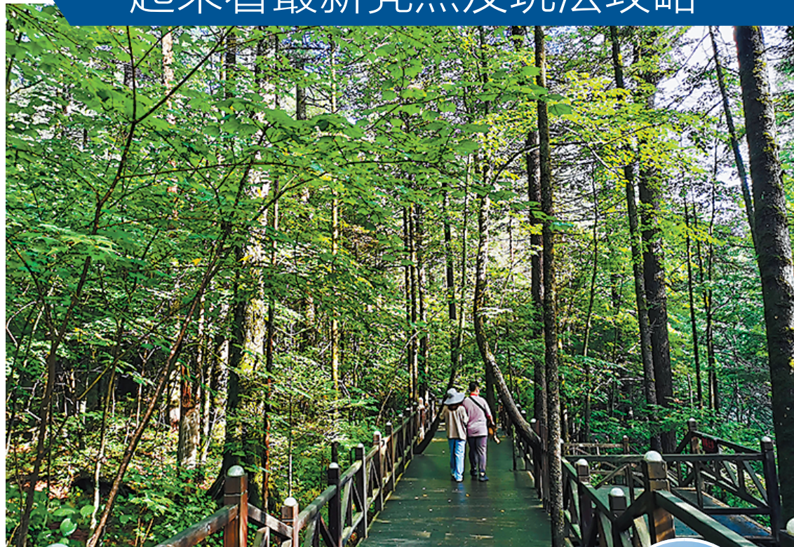
长白山参天蔽日的森林步道

据了解,因疫情后旅游市场复苏的种种利好政策支持,目前,以吉林长白山五、六日深度游产品为代表的东北暑期游线路,以及即将上架的东北秋游产品,依然有着最低两千多元的“史上最高性价比”。在这个虽已立秋但仍火热炙烤的漫漫暑期,对广东游客来说,飞去凉爽的长白山、大东北,感受“东北最佳旅游季”,不失为明智之选。