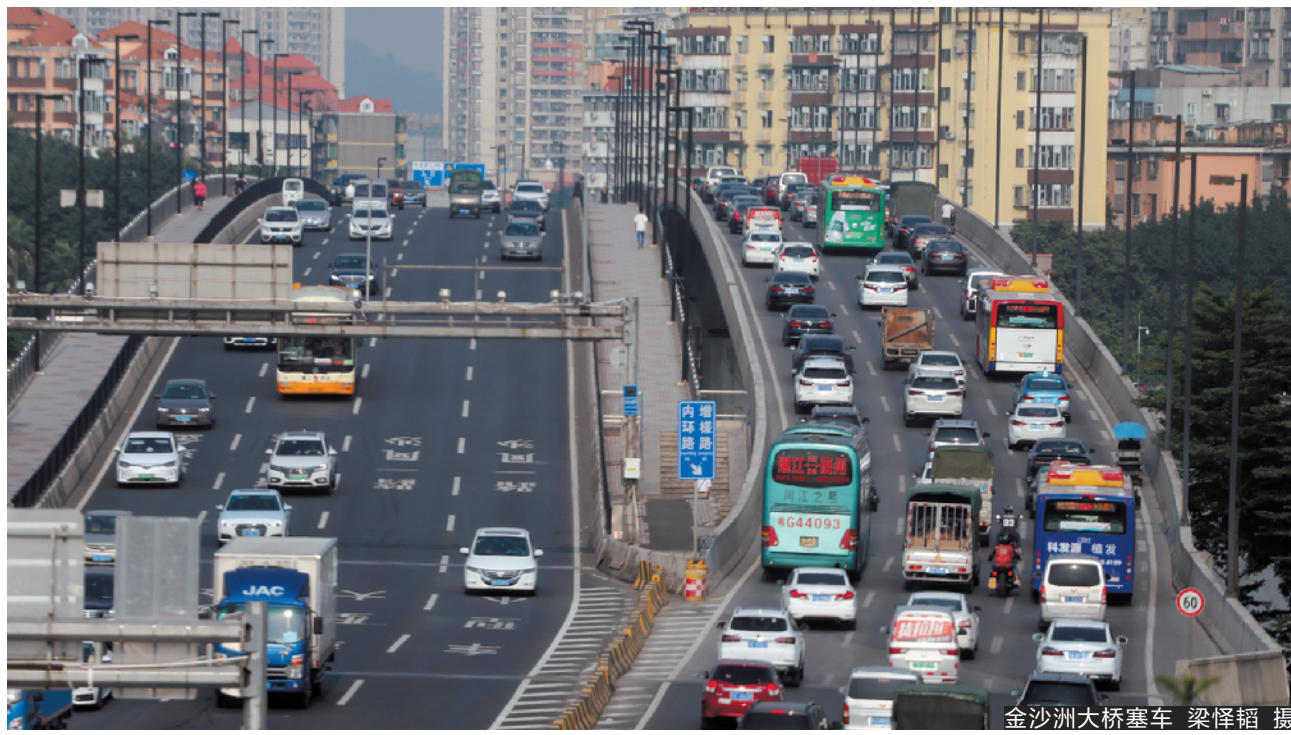
金沙洲大桥塞车

住在广州、佛山交界的金沙洲居民,自称“洲民”。每天早晚,至少十几万“洲民”出入金沙洲,要挤唯一一条过江大桥金沙洲大桥。早在2007年,广佛两地就说要增建两座过江大桥——沉香大桥、大坦沙大桥,然而,13年过去了,两座大桥一直没有开工。