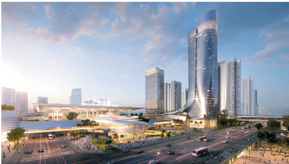
广州北站“空铁联运”建设效果图

19日,广州市人民政府新闻办公室举行第166场疫情防控复工复产新闻发布会。记者从会上了解到,花都正结合白云国际机场三期扩建工程,推进空铁融合示范区规划设计、广州北站综合交通枢纽建设和机场周边旧村改造。广清城际、新白广城际预计10月开通运营。