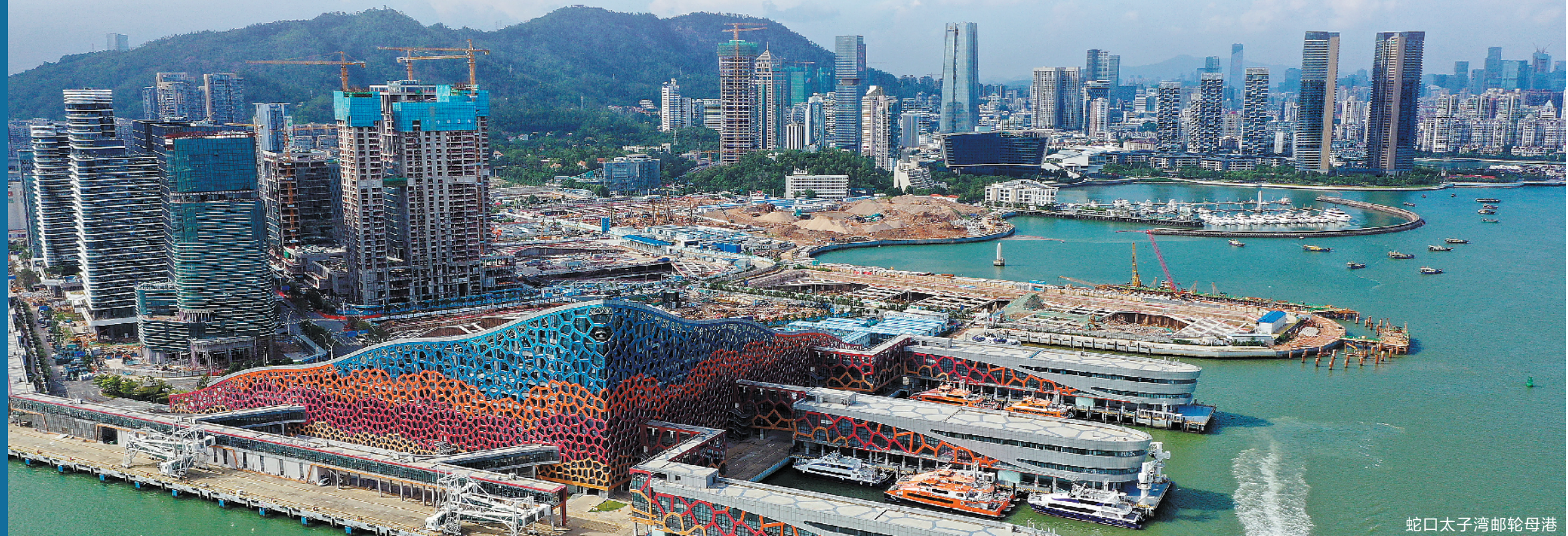
蛇口太子湾邮轮母港

炸山过后，要把装满土石方的翻斗车拉到不到一公里外的岸边卸下来，当时的施工队沿袭的是“大锅饭”方式，工人们干多干少，都是一样的工分，工程