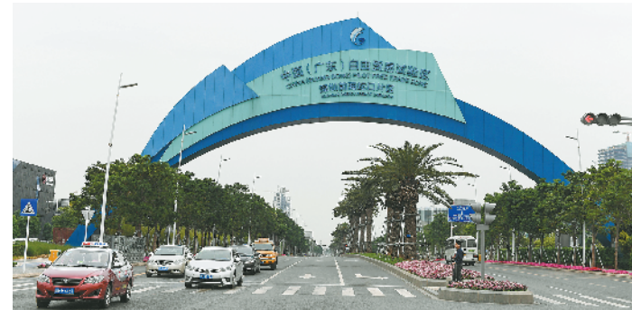
拱门以南是11.23平方公里的蛇口自贸区

从今天起，羊城晚报推出《特区从这里起步》系列报道，多角度反映经济特区发祥地在改革开放和建设发展中的奋斗历程，展现其在新时代的新担当、新作为。敬请关注。