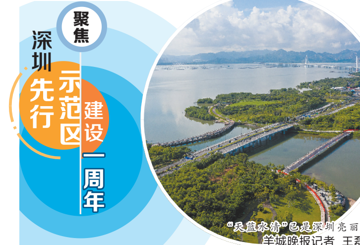
“民生幸福”也是深圳亮丽名片

李希代表省委、省政府对督察组进驻广东表示欢迎,对国家统计局长期以来给予广东工作的指导支持表示感谢。他说,我们要认真学习贯彻习近平总书记关于统计工作的重要论述精神,进一步做好统计工作。要切实扛起做好统计工作的政治责任,坚决把总书记、党中央关于统计工作决策部署落到实处,防范和惩治统计造假、弄虚作假,以实际行动