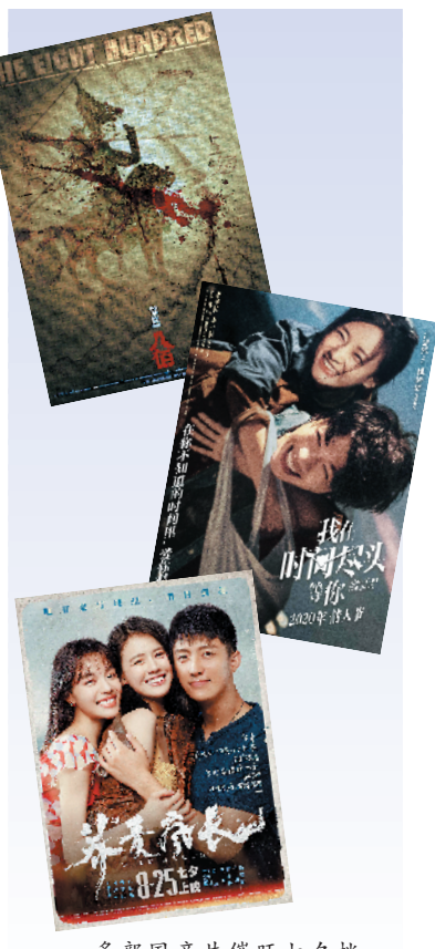
多部国产片催旺七夕档

后疫情时代，电影业如何在重启之后实现全面复苏乃至进入加速期？5G时代的到来也许是一次机会。5G技术作为国家新基建的排头兵，正在开启互联网新时代。5G对电影发展有何影响？5G会如何改变制片、发行、放映等各个产业环节？5G给影视企业带来哪些机遇与挑战？本届北影节举办的“5G时代电影的发展与变革”主题论坛，邀请到一众业内嘉宾共同探讨5G时代可能引发的中国电影全产业链的变迁。