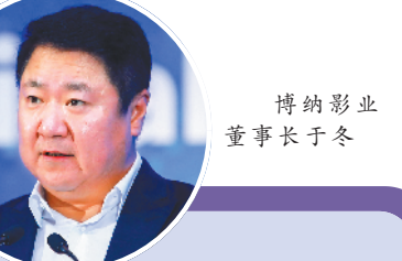
博纳影业 董事长于冬

作室宣布联合成立“电影工业化实验室”，将对标好莱坞，并结合国内电影的发展现状，为中国电影工业梳理出一整套适合我国特色的制作标准。郭帆表示：“电影工业化是流程、是分工、是效率。虚拟拍摄其实不仅仅是技术，而是流程的再组合，这需要我们改变传统观念并不断去探索新的制作实践。”据悉，乌尔善、郭帆、陈思诚、饶晓志、路阳五位导演更以拍摄短片《拐点》的方式，助阵“电影工业化实验室”的建立。