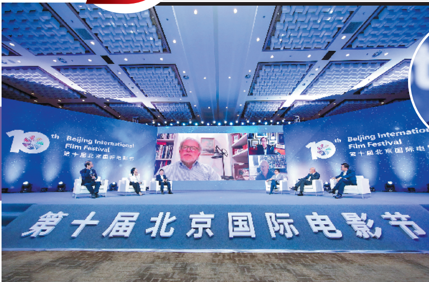
“探寻电影之美”高峰论坛

后疫情时代，电影业如何在重启之后实现全面复苏乃至进入加速期？5G时代的到来也许是一次机会。5G技术作为国家新基建的排头兵，正在开启互联网新时代。5G对电影发展有何影响？5G会如何改变制片、发行、放映等各个产业环节？5G给影视企业带来哪些机遇与挑战？本届北影节举办的“5G时代电影的发展与变革”主题论坛，邀请到一众业内嘉宾共同探讨5G时代可能引发的中国电影全产业链的变迁。