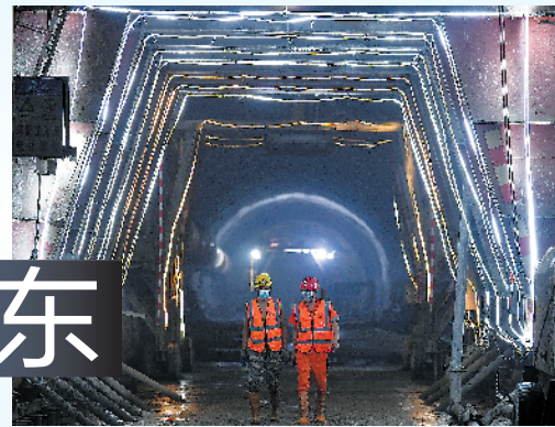
施工人员在大丰华高速公路控制性工程鸿图特长隧道施工现场