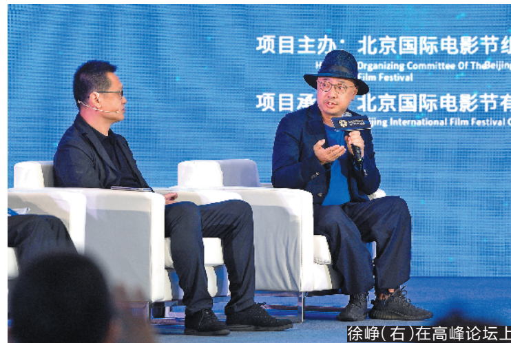
徐峥(右)在高峰论坛上

在全球新冠疫情还没过去的背景下,本届北影节创造性地以线上与线下结合的模式展开。10场主题论坛、4场大师班分享、16节电影课堂以及精彩的创投活动,首次集体以“云端”形式呈现,让专业内容与观众“零距离”。本届北影节成功践行了“十年之约”,率先吹响了电影复兴的号角,为影迷们奉上了一场精彩的电影盛会。