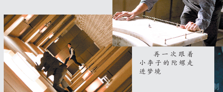
再一次跟着小李子的陀螺走进梦境

个跟走廊同心的圆环,使走廊得以悬空并旋转,这些圆环由两部巨大的发动机操纵。《盗梦空间》不仅视听技术让人惊叹,其讲故事的方式如今看来也依然精巧。影片将一个简单的故事用“盗梦”概念包装起来,既能给观众带来解谜的乐趣,又不至于过分晦涩。片中的明线是一个商业谍战故事:柯布(莱昂纳多·迪卡普里奥饰)的团队接到齐藤(渡边谦饰)的委托,把一个想法植入其竞争对手的脑中,以此瓦解对手的商业帝国;暗线是一个“自我救赎”的故事:柯布一直因为自己害死了妻子而耿耿于怀,在行动过程中,他最终冲破了自己的心理障碍……诺兰构建出一个严谨的梦境体系,梦境一层套一层,让人产生“何处是梦?何处是现实?”的特殊观感。