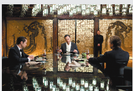
《盗梦空间》上映十周年了

在《盗梦空间》重映这个档期,已经有《八佰》《我在时间尽头等你》《荞麦疯长》《小妇人》等多部新片上映,重映片的市场空间已经明显收窄。不过,《盗梦空间》重映的目的也是“醉翁之意不在酒”,主要是为诺兰的同类型新作《信条》预热。《信条》将于9月4日在中国内地上映,并提前一周开始预售。此时《盗梦空间》重映,是为了让影迷“重温旧梦”,催谷《信条》的预售票房。此次《盗梦空间》重映也并非“中国特供”;今年《盗梦空间》首映十周年,华纳兄弟从8月12日开始就在全球举行《盗梦空间》重映活动,除了中国之外,在日本等地也进行了重映。