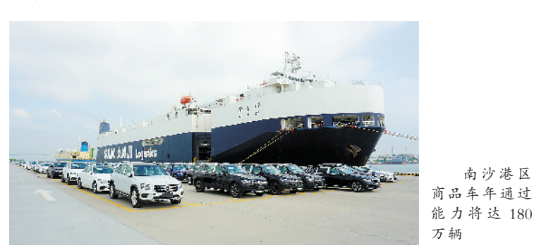
南沙港区商品车年通过能力将达180万辆

辐射和带动作用具有重要意义。海嘉码头与南沙汽车码头一体化运作后,南沙港区将形成拥有5个滚装汽车专用泊位、1.1公里码头岸线、61.9万平方米商品车堆场(其中露天53.7万平方米,室内8.2万平方米)的滚装码头作业区,商品车年通过能力180万辆,能为汽车主机厂、滚装航运枢纽建设的重点项目,项目建设对于满足广东省特别是珠江三角洲汽车吞吐量快速增长需求,适应汽车滚装大型化,提高广州港滚装汽车通过能力,充分发挥南沙港区对腹地经济发展的