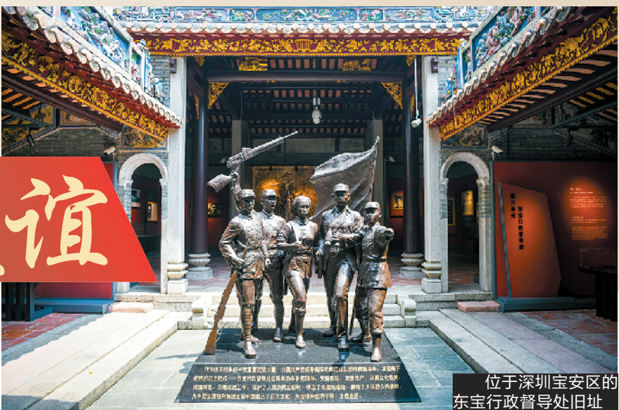
位于深圳宝安区的东宝行政督导处旧址

珠江东岸的所有日军占领地区，提供了很多极有价值的情报给第十四航空队和在华美军司令部。 黄文德介绍，抗战后期，袁庚负责的情报体系有两个重大发现，一是发现和绘制了日军在汕头沿海和东山岛构筑的工事，二是在广州、东莞发现了日军最精锐的波雷部队。“盟军根据情报，最终放弃登陆作战、与日军正面冲突的计划，直接在日本本土投放两枚原子弹结束了战争。” 1947年，为了感谢东江纵队所作的贡献，英国邀请黄作梅到伦敦，参加庆祝二战胜利大游行，并授予他勋章。