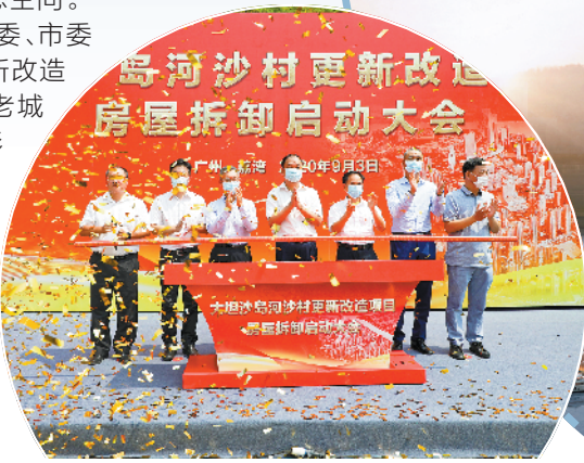
荔湾河沙村房屋拆卸启动现场