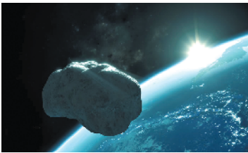
“迷你月亮”模拟资料图片

Wierzbach表示,这是继2006年发现“2006 RH120”小行星后,第二个被发现受地球引力牵引的小行星。而之前“2006 RH120”也是通过