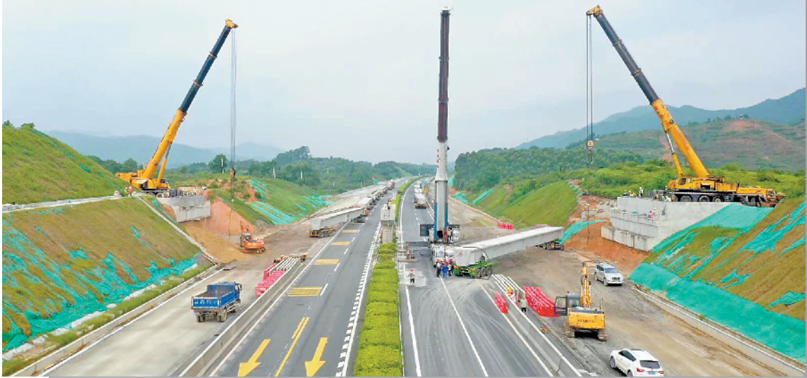
9月初,阳茂高速公路改扩建项目完成全线跨线桥架设,全线预计2021年建成通车

该项目起于阳江市江城区白沙街道,止于茂名市电白区观珠镇,线路全长79.76公里,主线采用双向八车道高速公路标准进行改扩建。工程建成后,将有效缓解粤西地区交通出行压力,促进粤西地区加快融入粤港澳大湾区。