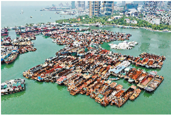
被查扣的非法走私船只

羊城晚报讯 记者郭起,通讯员张奎报道:4日,深圳公安召开新闻发布会,通报“2020净海-40”专项行动成果。截至2日,行动累计侦破走私案件23起,抓获涉案嫌疑人346人,查扣涉走私冻品508.39吨,侦破过渡案件66起,抓获偷渡涉案人员145人,有力打击了走私偷渡违法犯罪分子的嚣张气焰,筑牢“外防输入”疫情防控海上防线。