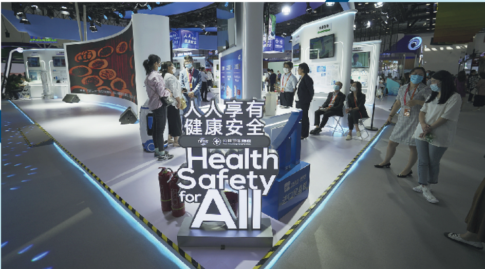
首次亮相服贸会的公共卫生防疫专区成为公众与媒体共同关注的焦点

在广东馆展区,专业做核酸检测的企业凯普医检的工作人员告诉记者,该公司1月29日就完成了两款新冠病毒核酸检测试剂盒的研制,能快速识别感染者,只要2小时就可完成实验。疫情期间,在北京、广州、重庆、武汉等地总检测量达到300万份。此外,企业和许多地方政府签订合作协议,通过派驻团队,推行大规模的社区人群筛查,可以达到日检万人的水平。