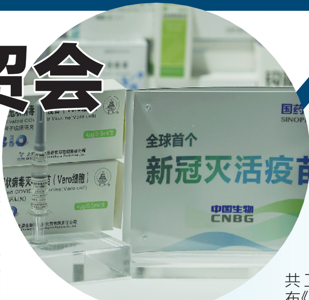
新冠灭活疫苗首次亮相

据介绍,疫苗将会是两剂免疫,间隔2周-4周。那么疫苗需要全人群接种吗?中国生物和科兴均表示,不管任何时候,疫苗接种都应该是知情和自愿的。不过,目前秋冬季来临,会和流感季节重叠,所以有关部门可能会考虑肺炎类、流感类的疫苗优先接种,预防流感类疾病对于医疗资源的挤兑。