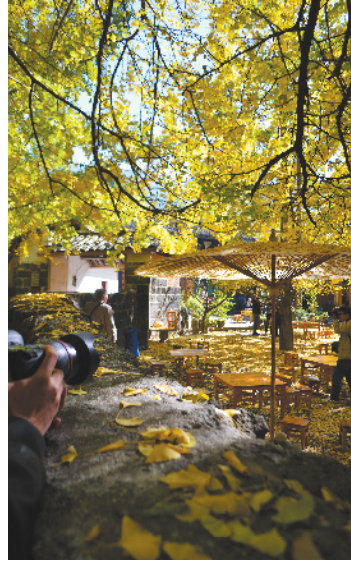
云南腾冲银杏村

梅里雪山、玉龙雪山、轿子雪山,雪景、小溪、枯草,云雾缭绕下的秋景就是一副美丽的画卷。在大理、丽江、香格里拉等古城里享受阳光也是一份难得的惬意。昆明大小湖泊上翱翔的海鸥则是云南秋游的好注脚。