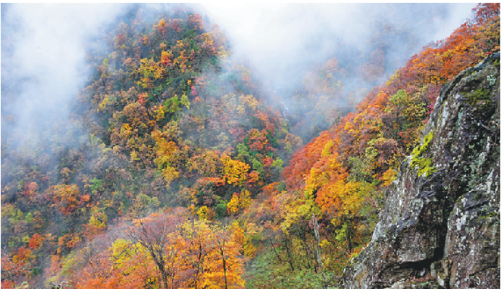
湖北神农架神农顶景区秋天风光

湖北宜昌三峡段也是长江上红叶最多的地方,呈现出万山红遍、层林尽染的绚丽景观,三峡大坝、三峡人家、清江画廊、恩施大峡谷等均是秋游好去处。