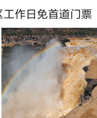
山西临汾壶口瀑布

东营黄河口生态旅游区,秋季是一年中最秀美的季节,茂密的芦苇荡以及碱蓬草形成的特色景观“红地毯”如烈火燎原,这里也是候鸟迁徙栖息的天堂,加上铁塔、风机和虾池,在晚霞的映衬下几乎美成了油画。