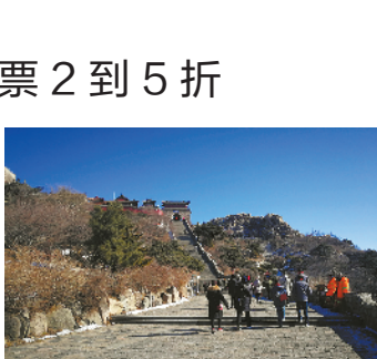
东岳泰山