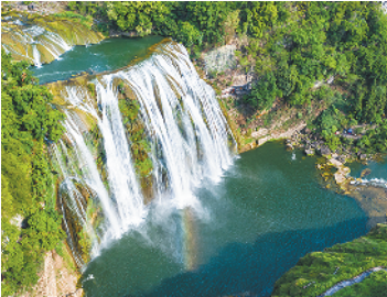
贵州黄果树大瀑布