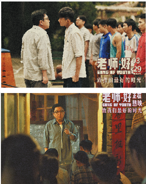
羊城晚报记者 胡广欣 实习生 卫弥萱

1985年9月10日，中国第一个教师节诞生，至今已经35年。从《母女教师》《一个都不能少》到《美丽的大脚》，新中国诞生了许多以教师为主角的影视作品。而近年的影视作品也出现了许多让人印象深刻的教师角色，他们有性格、接地气。你最想成为哪位老师的学生？