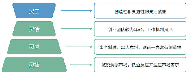
抖音平台创造的“灵工”模式

字节跳动副总裁张羽在报告发布会现场表示,在抖音上,英雄不问学历、年龄,更加看重能力和胜任力。这意味着抖音的就业性质是一种普惠性就业,是人人都可以拿起手机表达自我,在抖音上找到就业机会。