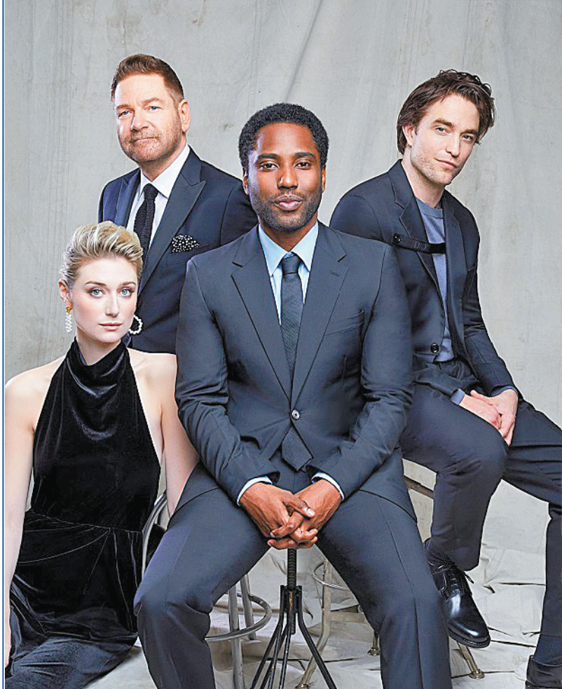
约翰·大卫·华盛顿(中)与《信条》剧组的伙伴们