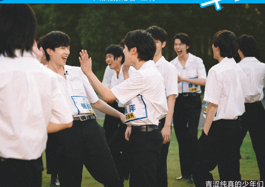
青涩纯真的少年们