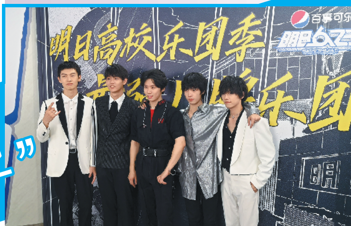
“气运联盟”乐团夺得冠军