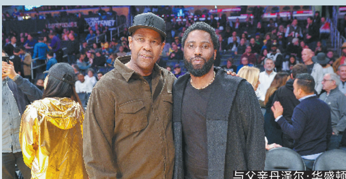
与父亲丹泽尔·华盛顿