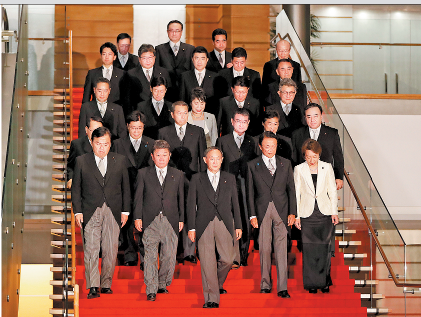
16日，日本首相菅义伟（前排中）率内阁成员走下楼梯，准备合影

行的重组、手机资费下调等施政任务。 外交方面，菅义伟提出以日美同盟为基轴，推进与中国、俄罗斯等国家构建稳定关系，同时将全力解决朝鲜绑架日本人问题。 8月28日，时任日本首相安倍晋三宣布因健康原因辞职。本月16日，日本召集临时国会举行首相指名选举。当天上午，安倍内阁在临时内阁会议上总辞职，这标志着创下日本史上在职时间最长纪录的安倍内阁谢幕。