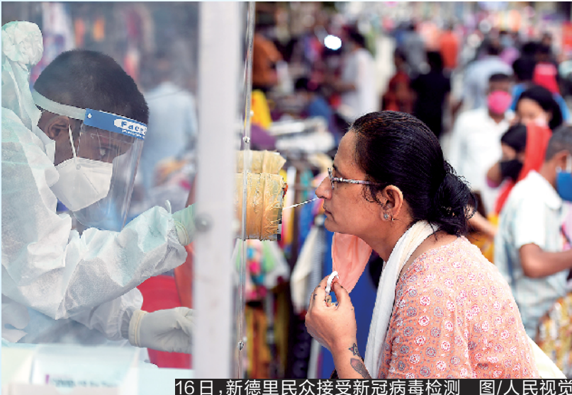
16日,新德里民众接受新冠病毒检测

分析人士指出,政府过早解除封锁措施和民众未严格遵守防疫规定,是印度疫情持续快速增长的重要原因,但如果此时强化防疫措施又势必令经济雪上加霜。面对这样严峻的形势,印度政府进退两难。