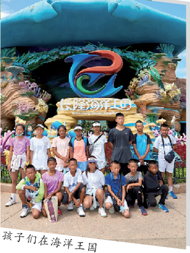
孩子们在海洋王国

正如张晓洪教练所说，他希望能培养出一个或多个的职业选手，但即便这群孩子们不能登上最高峰，他们也能凭借网球上一个不错的大学，或成为一名网球教练，有了安家立命的本领。在这个9月，这群从云南山区走出的“野象”们看见了一个不一样的世界，或许在他们中不会有人在大满贯赛场上挥洒汗水的经历，但这段独特的经历一定会给他们留下一段美好的回忆。