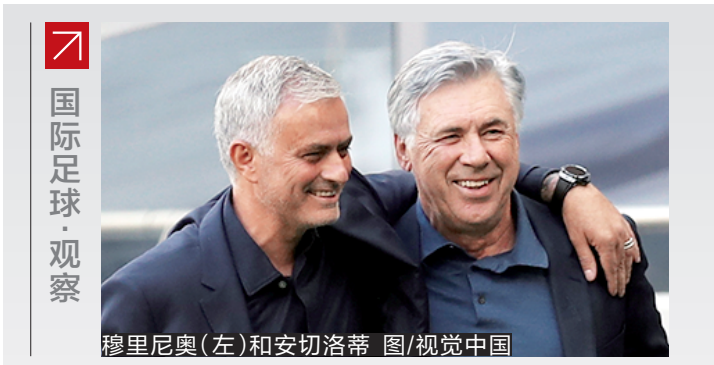
穆里尼奥(左)和安切洛蒂