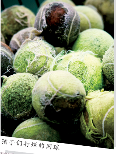
孩子们打烂的网球