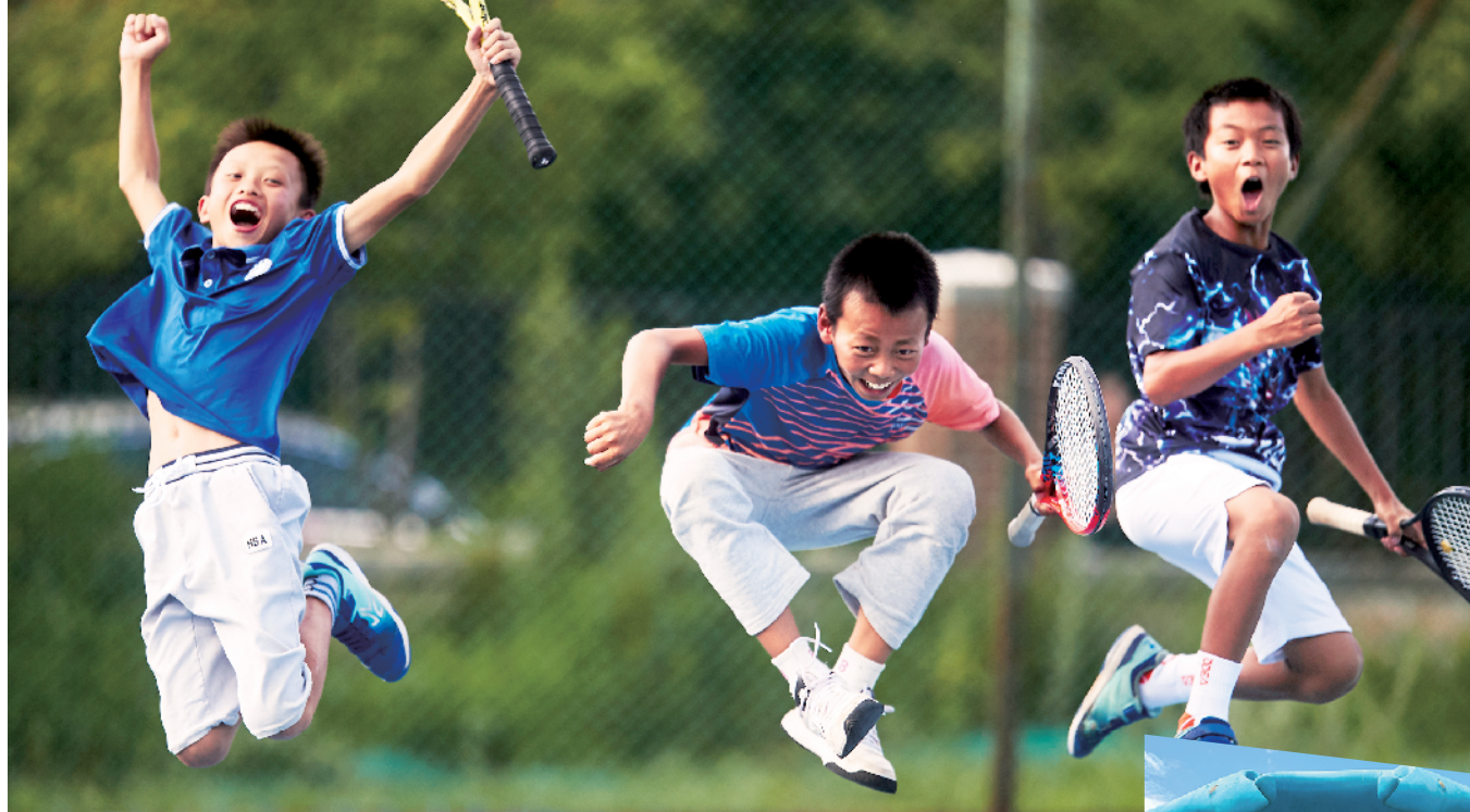
孩子们为胜利雀跃欢呼

不过对于富力队来说，板凳深度不足始终是隐患，未来9天三战对球员体能和精力都提出挑战。在联赛富力还有冲击前四的希望，剩下三轮面临的硬战也不少，因此轮换势在必行。