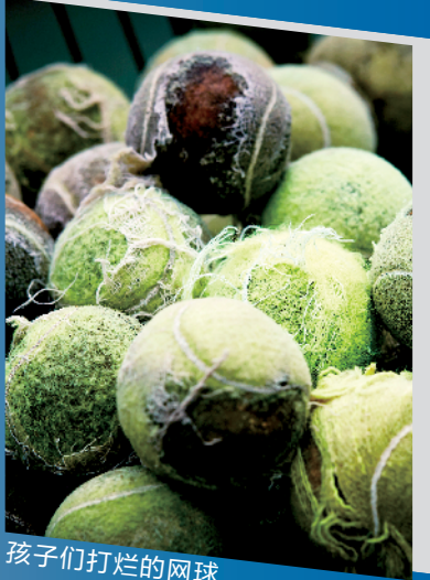
孩子们打烂的网球