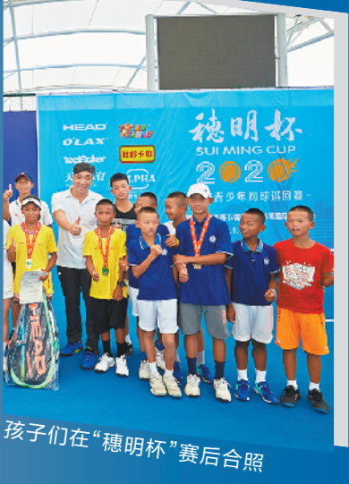
孩子们在“穗明杯”赛后合照