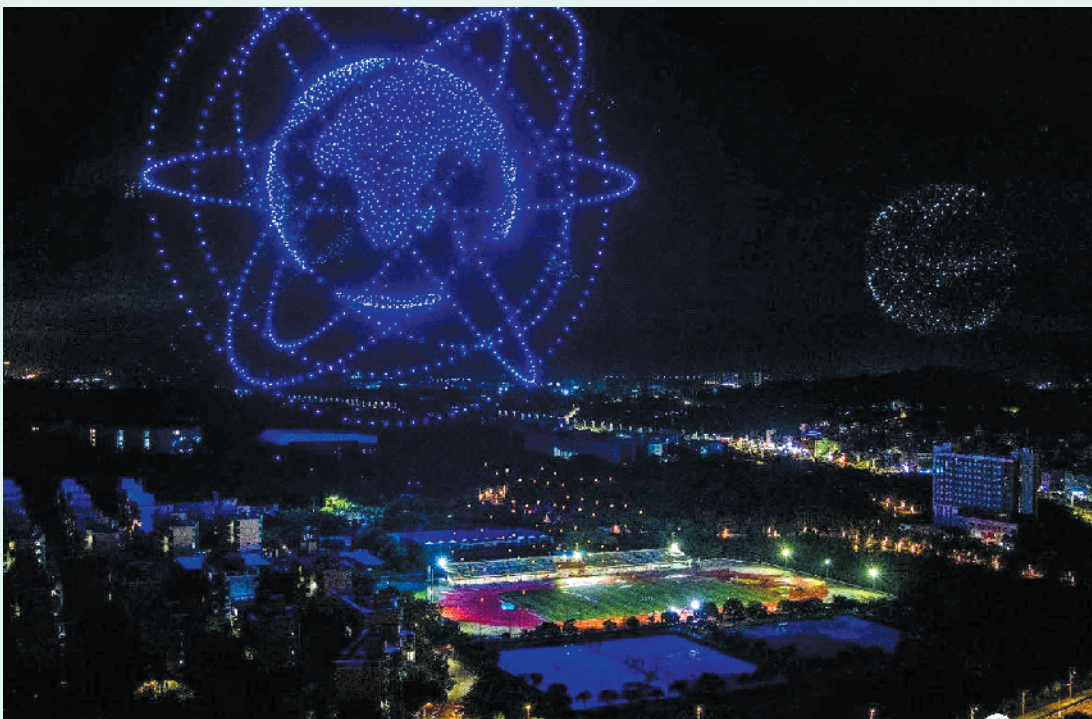
无人机变映出“北斗”图案

凌晨3时40分,挑战项目顺利完成,认证官在确认挑战成功后为大漠大智控团队颁发认证证明。据介绍,大漠大智控于2016年4月成立,曾多次参演执行国内外多场无人机编队灯光秀表演,拥有3500余场零失误表演经验。