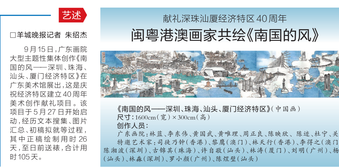
《南国的风——深圳、珠海、汕头、厦门经济特区》(中国画) 尺寸:1600cm(宽)×300cm(高) 创作人员: 广东画院:林蓝、李东伟、黄国武、黄唯理、周正良、陈映欣、陈迹、杜宁、关坚、特邀艺术家:司徒乃钟(香港)、黎鹰(澳门)、林天行(香港)、李得之(澳门)、陈湘波(深圳)、古锦其(珠海)、许自敬(汕头)、林涛(厦门)、刘明(广州)、杨星(汕头)、林森(深圳)、罗小颜(广州)、陈煜壁(汕头)

作品重点展示40年经济特区建设中对于国家长远发展重要作用与深远意义的成就内容。作为经济特区建设40年来最闪亮的成果,深圳在作品中重点展现,如“南方明珠”盐田港;“深圳改革打响第一炮”的前海、蛇口自贸区;华为、腾讯等代表性企业建筑大楼;深圳平安金融中心、深圳会展中心等城市建筑地标;深圳市改革开放博物馆、深圳博物馆、关山月美术馆、城市雕塑《开荒牛》、《深圳人的一天》等文化艺术地标及经典;海洋建设工程成就“蓝鲸1号”…… 珠海经济特区板块则重点选取了港珠澳大桥、横琴自贸区、珠海大剧院、珠海海洋科学